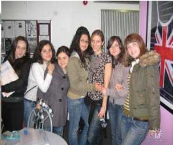
2008 წლის პროექტის მონაწილეები