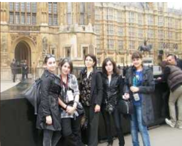
2010 წლის პროექტის მონაწილეები

2011 წლის გაზაფხულზე ლონდონში ჩვენი სკოლის მოსწავლეებთან ერთად გაემგზავრნენ ზესტაფონის სკოლის „ანაბასისი“ და თბილისის 98-ე საჯარო სკოლის